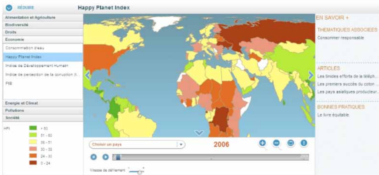
Happy Planet Index